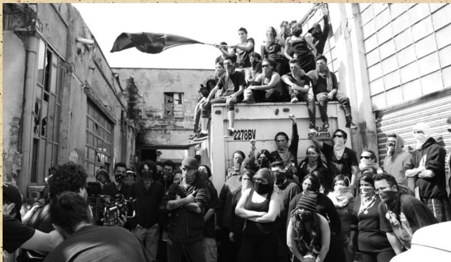
GRABACIÓN VIDEOCLIP "PROTESTA"