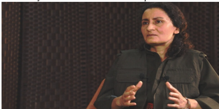
Co-presidenta del Consejo Ejecutivo de la Unión de Comunidades de Kurdistán (KCK), Besê Hozat

El 15 de febrero es un día negro para los kurdos y las kurdas. Es un día de genocidio. El objetivo de la conspiración internacional ( ataques contra el Movimiento por la Libertad del Kurdistán en torno al encarcelamiento ilegal de Abdullah Öcalan el 15 de febrero de 1999 ) es llevar a término el genocidio kurdo. Por lo tanto, me gustaría condenar a las fuerzas internacionales que están detrás de la conspiración. La conspiración internacional se ha estado llevando a cabo en diversas formas durante 24 años, sin interrupción. Continúa en forma de ataques genocidas en el Kurdistán del Norte ( sudeste de Turquía ), de ocupación y ataques genocidas en el Kurdistán del Sur ( norte de Irak ) y de ocupación y ataques genocidas en Rojava ( Kurdistán sirio ). Continúa en forma de asesinatos, asesinatos políticos y masacres en Europa. Pero también hay una fuerte lucha contra la conspiración internacional.