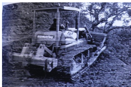
Fotografías oficiales de obras que nunca se realizaron en Santiago Xanica.