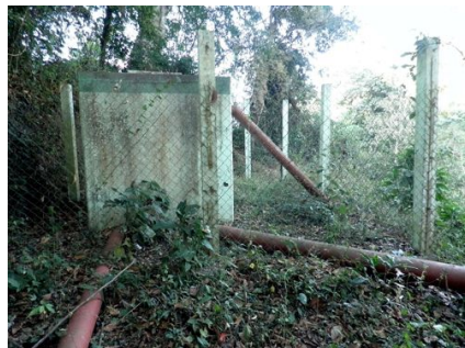
Entubación del Río Copalita.