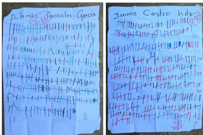
Papelógrafos de la votación del 5 diciembre 2010.