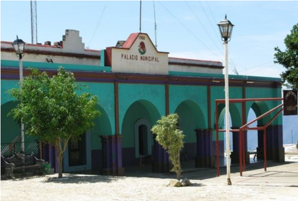
Palacio Municipal de Xanica.

Evidencian los testimonios que no se trata sólo de ganar los 3,000 o 5,000 pesos mensuales que les tocan a las autoridades municipales, sino de manejar a propio beneficio los recursos de los proyectos municipales que llegan desde el Estado o la Federación, los ramos 33 y 28. En este sentido ocupar un puesto público en el municipio, permite hacer buenos negocios a través de las redes de los caciques de la zona.