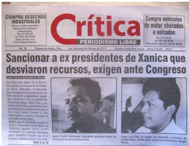
Periodico Crítica, 1ra. quincena de febrero de 2011.

“Es una vergüenza comprar a la gente porque la gente no tiene precio”. (un integrante del CODEDI-Xanica)