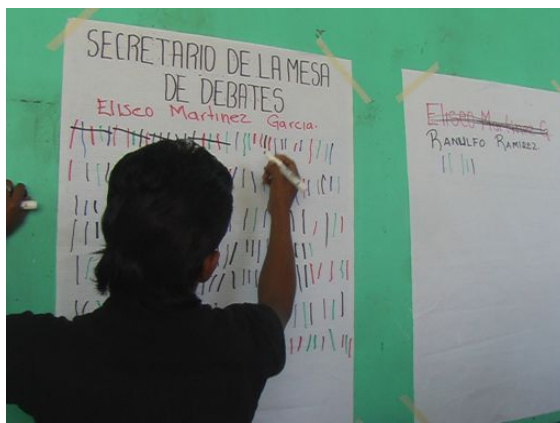
Momentos de la votación del 5 diciembre 2010.