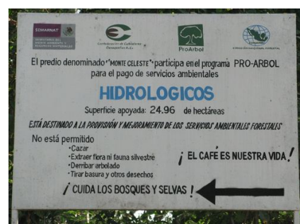
Programas de Gobierno.

Especialmente, en el territorio que abarca el Municipio de Santiago Xanica y sus alrededores, estos consorcios de grandes empresas buscan implementar proyectos turísticos e infraestructurales, como la mercantilización del Río Copalita (viajes de aventura, rafting/rápidos, eco-resort en el bosque); la apertura de una nueva carretera desde La Venta a los municipios los Ozolotepec y de ahí hasta Xanica y Santa María Huatulco; la realización del proyecto eco-turístico en Agua Caliente en San Mateo Piñas y la pavimentación de la carretera Huatulco-Xanica-San Mateo Piñas para facilitar el acceso de turistas y militares; la entubación del Río Copalita a beneficio de los hoteles de las Bahías de Huatulco (ya parcialmente realizada en el 2005); la privatización del manantial del Río San Jeronimo para las empresas embotelladoras (entre otras, Nestlé y Coca Cola); el control Federal sobre cientos de hectáreas de bosques a través de los pagos por servicios forestales; la probable perforación del subsuelo en búsqueda de yacimientos de uranio; la mercantilización de las plantas medicinales, a través de las patentes de la industria farmacéutica, como el caso del botonchihuite, una hierba que se utiliza para curar la disentería y el paludismo.