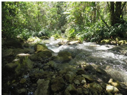
Río San Jeronimo.

políticos de actores más grandes de las dos familias mencionadas. Se trata de lobbies que, codo a codo con los políticos de todos los partidos, buscan hacer enormes negocios en los territorios indígenas; son los beneficiados por las políticas neoliberalistas de los gobiernos como el Plan Puebla Panamá (ahora llamado Plan Mesoamerica) que en la sierra sur zapoteca se traduce en proyectos como el Cuenca Copalita-Tonameca, los proyectos turístico en la costa Chacahuha-Huatulco, la presa Paso de La Reina, la autopista Huatulco-Salina Cruz, las concesiones a las transnacionales mineras y el despojo y la privatización del territorio en general.